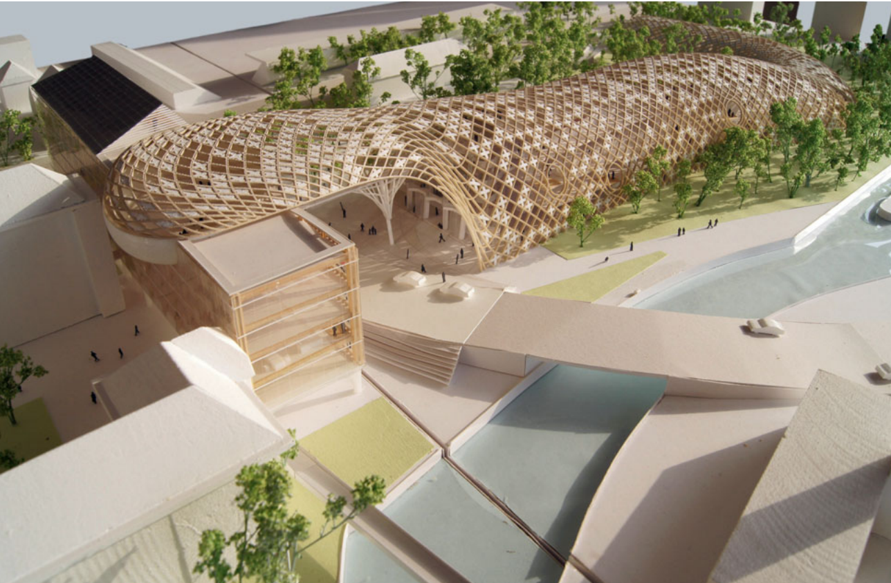
Der auffällige Holzbau verbindet die verschiedenen Gebäude von Omega und Swatch.

bettet zwischen den historischen Gebäuden der Omega und dem neuen, auf Säulen gestellten Zentralbau, entsteht ein neuer Besucher- ein- gang in Form eines Platzes, die «Omega Plaza». Von der Jakob-Stämpfli-Strasse aus führt dieser Zugang über eine Ringstrasse in den Innenbereich des Firmenareals und zu den Eingängen der Museen.