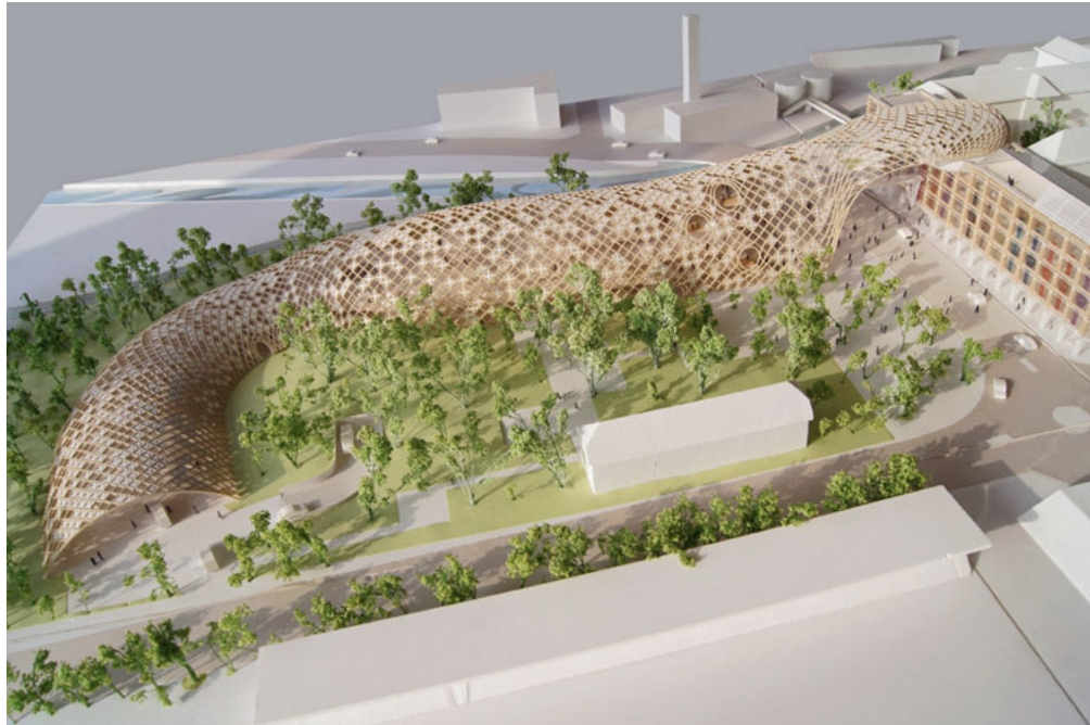
Der lang gezogene Swatch-Bau ist eine moderne halbrunde Holzfachwerkkonstruktion.