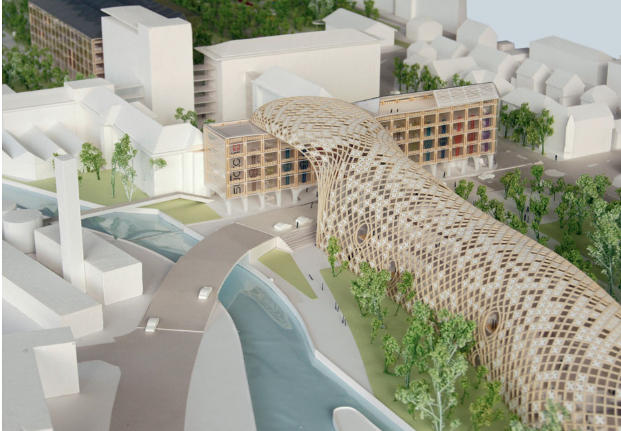
Ein völlig neues Gesicht für den Swatch- und Omega-Hauptsitz in Biel.

Text: Werner Müller, pd